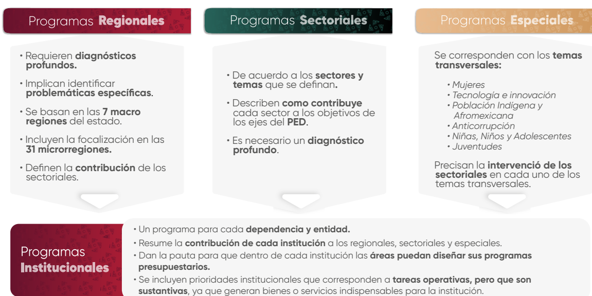
Esquema 1. Estructura de los Programas Institucionales

En el contexto de la planeación táctica del Gobierno del Estado de Puebla para el periodo 2024–2030, los programas institucionales están estructurados a partir de un marco estratégico que incluye: misión, visión, valores, ámbito funcional y componentes estratégicos. Estos componentes definen la participación de las instituciones en los Programas Regionales, Sectoriales y Especiales , (Véase Esquema 1 ), los cuales son instrumentos clave para la implementación de las políticas públicas estatales. Dichos programas están alineados con el Plan Estatal de Desarrollo del Gobierno del Estado de Puebla 2024–2030 (PED), y tienen como propósito orientar la acción gubernamental mediante objetivos, estrategias, líneas de acción e indicadores y metas medibles, enfocados en atender las necesidades prioritarias de la población.