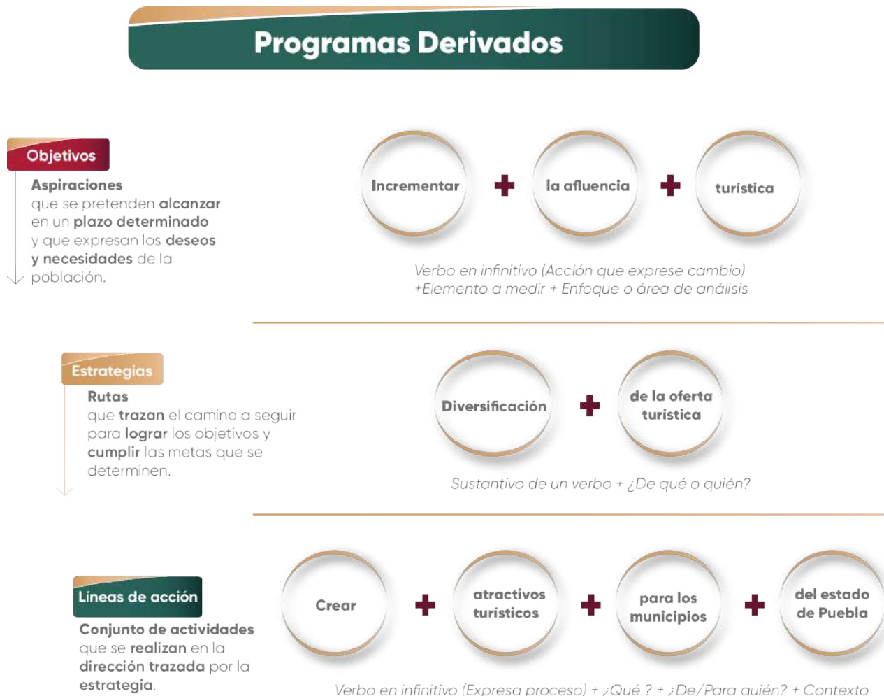
Esquema 3. Sintaxis para la Redacción de los Nuevos Componentes Estratégicos

3.1 Si la respuesta es afirmativa: Se analizará si la línea de acción faltante puede ser vinculada a algún objetivo y/o estrategia ya existente en los Programas Sectoriales y Especiales. Si no es posible establecer dicha correspondencia, la institución deberá desarrollar un árbol de problemas y soluciones, con el fin de sustentar la integración de nuevos componentes estratégicos, asegurando su inserción dentro del marco estructural establecido (Eje, Temática, Objetivo, Estrategia, Línea de Acción, Indicador y Meta). En todo momento deberá conservarse la consistencia estratégica y aplicar la siguiente sintaxis para la redacción de los nuevos componentes estratégicos (Véase Esquema 3).